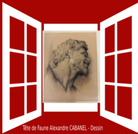
Tête de Faune Alexandre CABANEL - Dessin

Fusain, estompe et rehauts de blanc sur papier